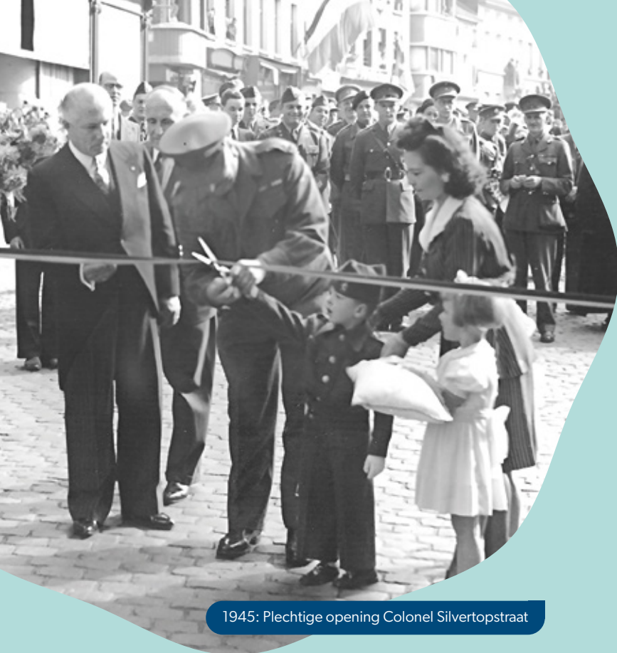
1945: Plechtige opening Colonel Silvertopstraat