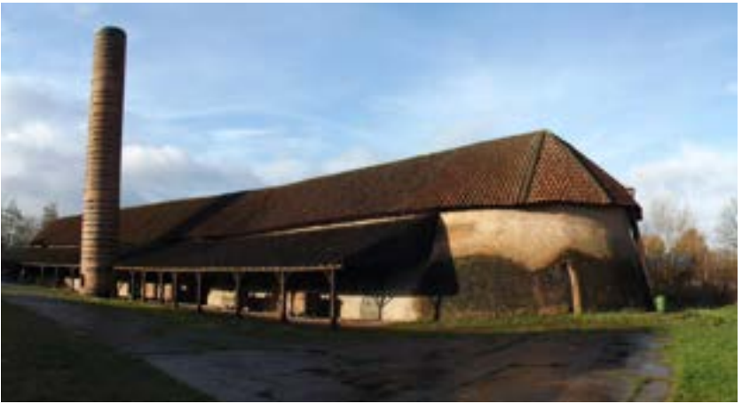
Ringoven 't Geleeg

Als je na de dorpswandeling 'versteend' bent en nood hebt aan verpozing in een groene omgeving, dan kan je de natuurwandeling (3,5km) volgen doorheen het natuurgebied Walenhoek. Dit voormalig kleiputtencomplex herbergt een gevarieerd landschap met broekbossen, hooilandjes, ruigtes en een 20-tal vijvers.