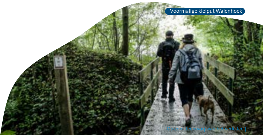
Op een steenworg van het verleden |