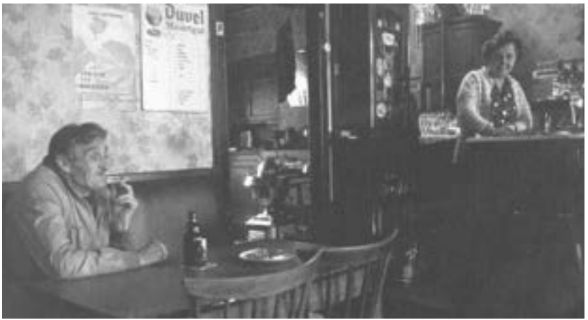
Café De Koophandel

Keer ter hoogte van Brik Boom terug richting knooppunt 329 en vervolgens naar 246.