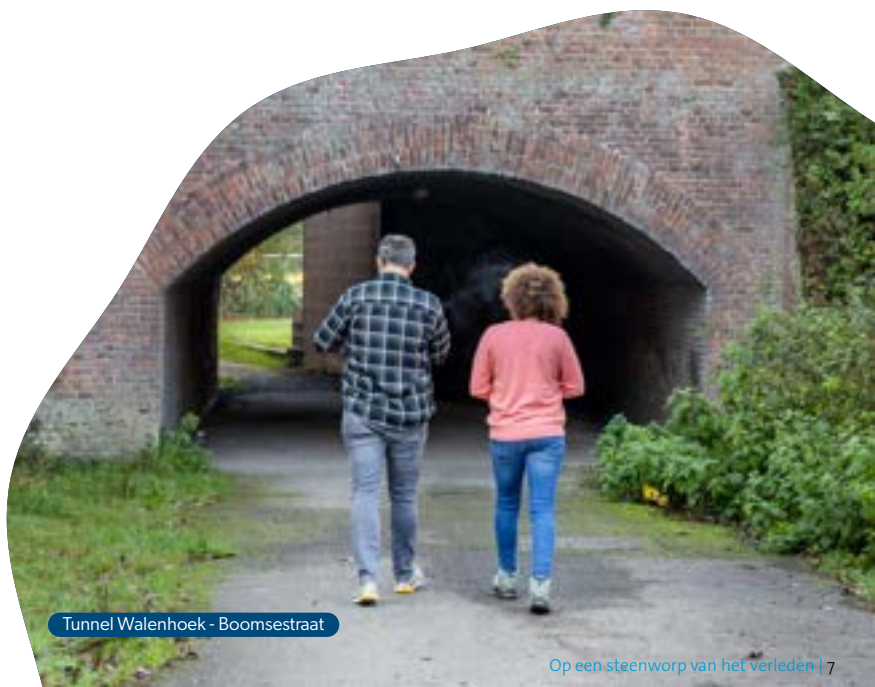
Tunnel Walenhoek - Boomsestraat

Aan de linkerkant vind je de vroegere dorpsschool voor jongens, nu het scoutslokaal. In de tuin bouwden de scouts enkele droogloodsen herop als onderdak voor hun festiviteiten.