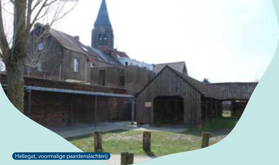
Hellegat, voormalige paardenslachterij

Het vierkante gebouw op de achtergrond is de voormalige paardenslachterij, Marnef van Hellegat. Paarden werden in de steenbakkerijen ingezet als lastdieren. Van oudsher werden ze beschouwd als heilige dieren die niet werden geconsumeerd. Pas vanaf midden 19de eeuw werden oude en afgeleefde paarden geslacht en werd het vlees verkocht, omwille van armoede. Paardenvlees werd verwerkt tot worst (gewone worst, boulogne, cervela) of als stoofvlees mals gekookt. Zo ontstond een typisch Vlaams volksgerecht, de 'schep', paardenstoofvlees dat ook nu nog met smaak wordt gegeten in de Rupelstreek.