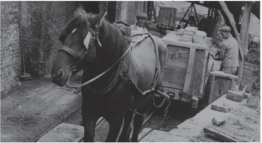
Het paard als lastdier

zijn nog steeds bewoond. Het is dus een vroege herbestemming van een kerkgebouw.