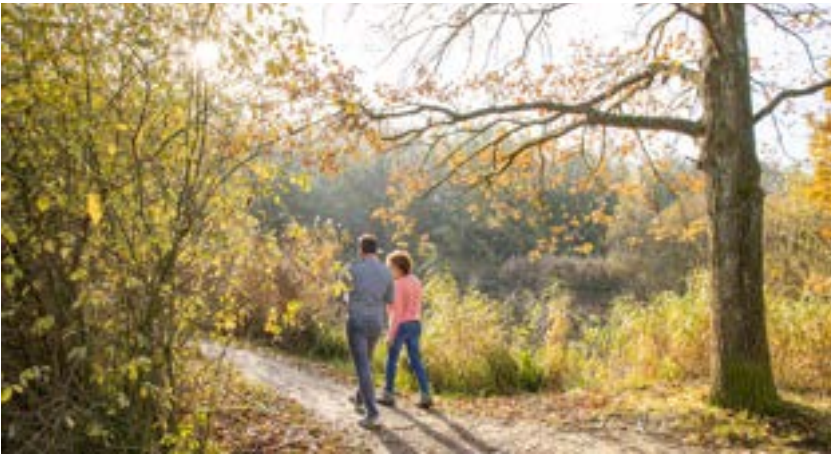
Voormalige kleiput Walenhoek

Bij knooppunt 303 liggen de vijvers van de visclubs. Vanaf hier wandel je door een pioniersbos. Dit is een bos dat bestaat uit lichtminnende boomsoorten die hun zaad via de wind verspreiden en zo als eerste open plekken kunnen koloniseren, zoals berk, wilg, els en abeel.