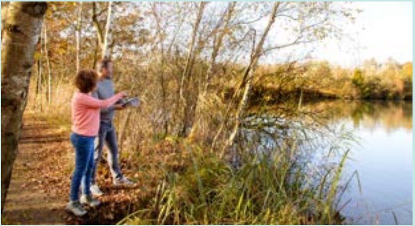
Voormalige kleiput Walenhoek

Sla links af en volg de brede dijk richting knooppunt 303.